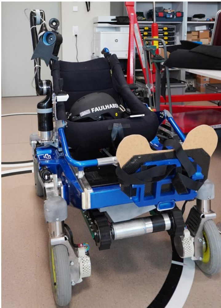
Rollstuhl entwickelt von den Enhanced Teams der OST Rapperswil