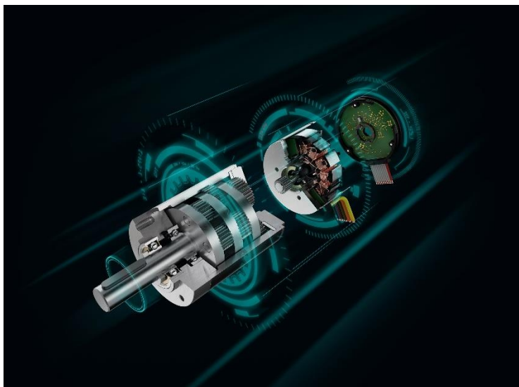
Sistemi di azionamento evoluti